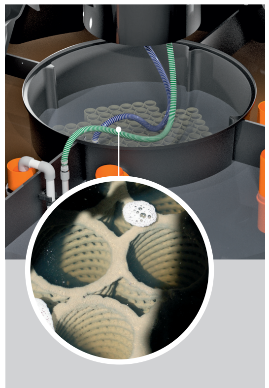
Lecho fijo con biofilm